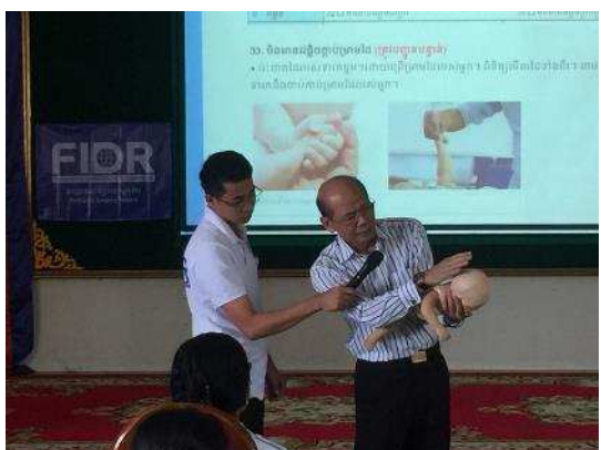
2-3-1 小児外科シンポジウムの開催 (講師: 国立小児病院外科医)