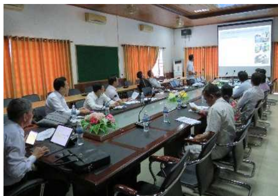
1-2-5 プロジェクト運営委員会の開催 (州保健局にて)