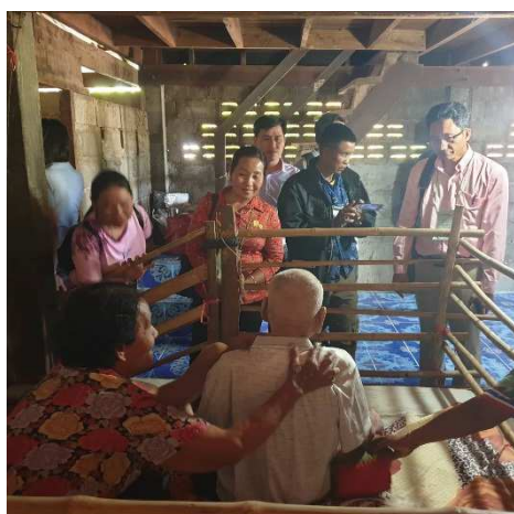
1-2-4 タイ医療機関視察研修 (患者訪問)