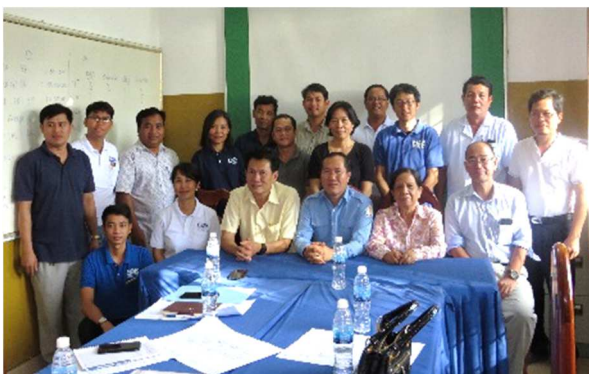
1-3-2 病棟詳細設計の説明会 (院長含む、カウンターパート向け)