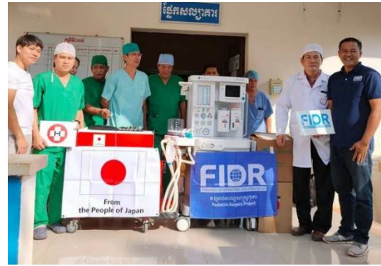
1-3-1 麻酔器の納品・引き渡し (右二人目:病院長)