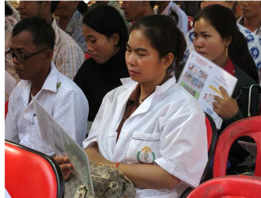
2-2-1 保健センター小児外科研修 (参加する保健センター職員)