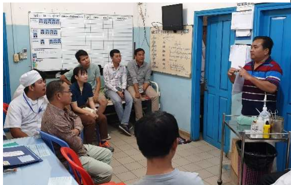
1-1-2 院内研修 (講師:外科看護師長)