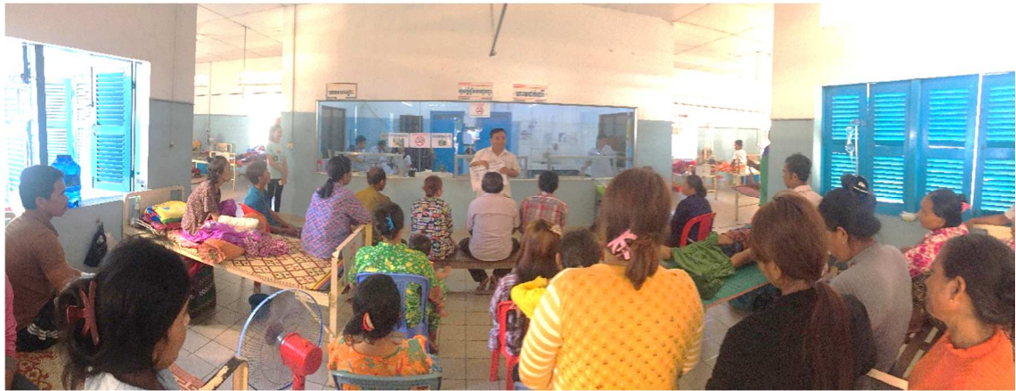
3-1-1 患者・家族への保健教育 (講師:外科看護師長)