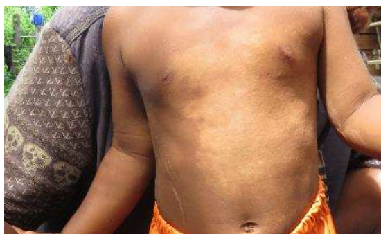
1-2-2 退院患者のフォローアップ (火傷の傷跡がほぼ残らず治癒している)