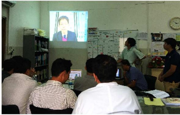
1-2-5 プロジェクト運営委員会 病院サービス改善部会 (東京事務所・小山から建設着工見通しの説明)