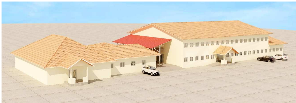
1-3-2 詳細設計に基づく病棟完成予想図