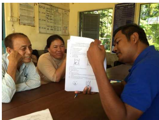
1-2-1 患者統計データ収集 (保健センターにて)