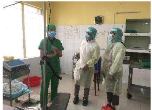
前川書記官と加藤委嘱員の来訪