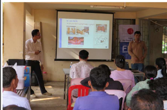
2-2-1 保健センター小児外科研修 (講師:小児外科普及リーダー)