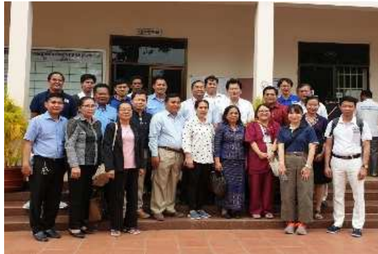
1-1-5 国内医療施設の視察研修 (コンボンチャム州病院訪問)