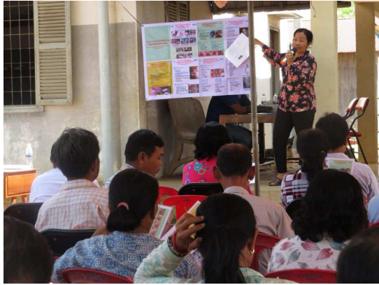
2-2-1 保健センター小児外科研修 (講師:小児外科普及リーダー)