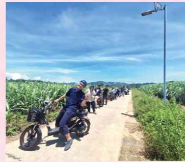
ムオン族の村をローカルガイドさんの後について、電動自転車周遊するツアー。