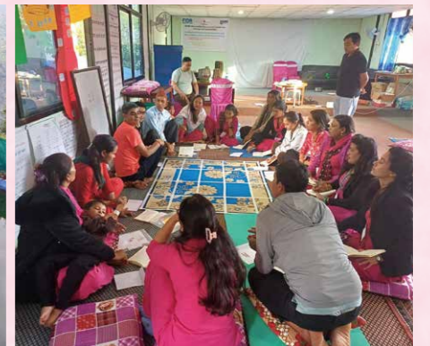
小学校教員向けに、指導力の強化を目的としておこなう研修の様子