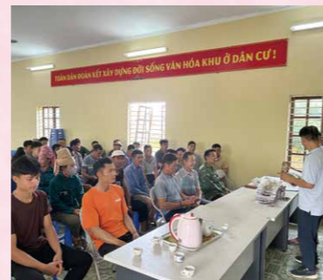
コーヒー農家へ研修をおこなう様子