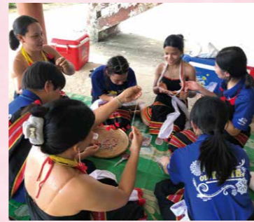
カヨン族のビーズ作り体験