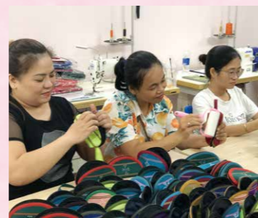
織物製品の検品をしている女性たち