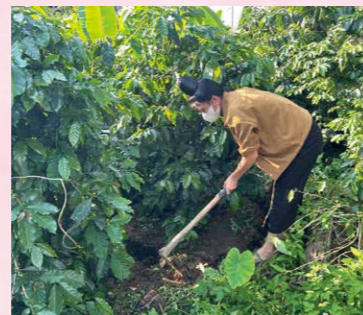
コーヒー畑を耕す女性