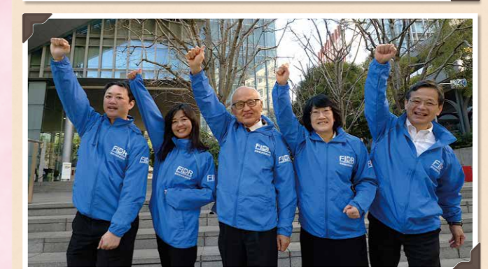
東京事務所スタッフ一同