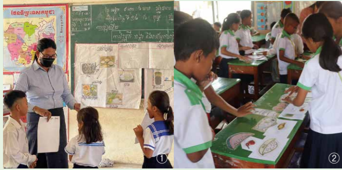
写真と図を用いたり (1)、アクティビティを取り入れて (2)、楽しみながら栄養を学べる授業を実施