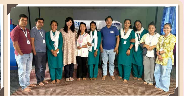
事業地でプロジェクトの推進、進捗管理をおこなうスタッフたち