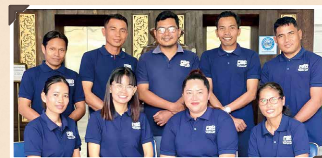
コンボンレーン郡農村開発担当スタッフ