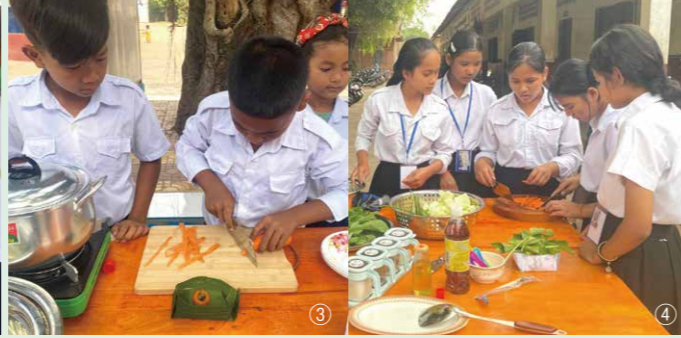
③④調理実習では、日頃料理作りを手伝っている生徒が大活躍!