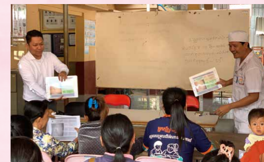
地域住民にも小児外科疾患の知識を広めることで、住民が症状に合わせて適切な手当て・受診をできるよう取り組んでいます。

各地区から選出されたキーパーソンが活動の核となり、農業・漁業の技術研修、補完食作りなどの健康啓発、ゴミ拾い活動を通じた衛生改善、先進的な事例を学ぶ視察訪問など、分野横断的に、活動をさらに加速させます。キーパーソンが意欲的に取り組むふりかけ作りは、首都のスーパーなどの小売店で消費者が手に取ることができるよう、サプライチェーンの強化に臨みます。