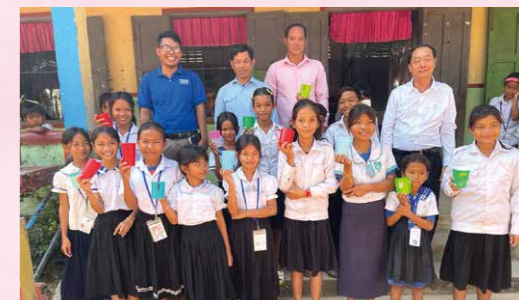
学校では、ゴミの排出量を減らすために生徒たちが自分のカップを持参して使います。