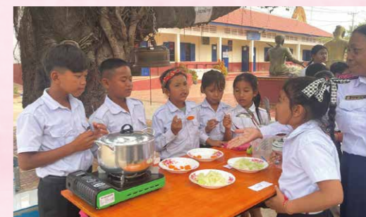
始まったばかりの調理実習では、生徒も教員も試行錯誤しながら料理の基礎を学びます。