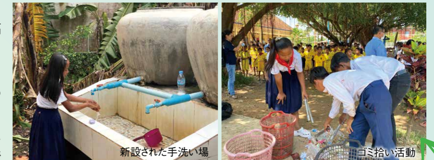
新設された手洗い場

麗になってきました。2024年には、ついに教育省から認証され、4校が公式に「モデル校」となりました。こうして学校が変わってきたのは、長い活動期間の中で、校長先生や教員たち自身に変化があったからです。